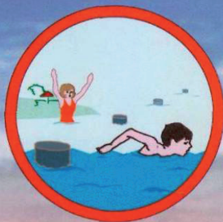
За буйки не заплывать!