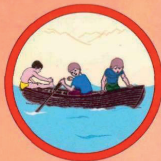
Не перегружайте лодку.