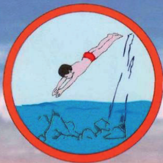
Не ныряйте в незнакомом месте.