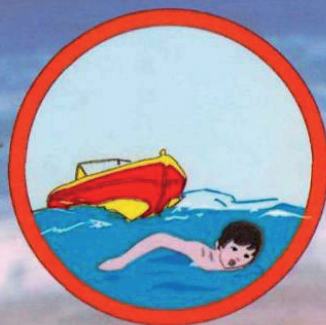
Запрещено плавание в судоходных местах!