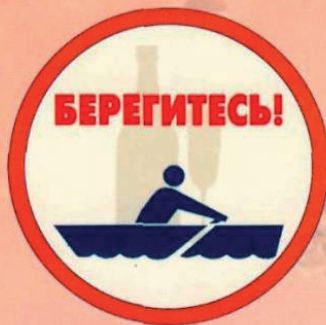
Запрещается употребление спиртных напитков.