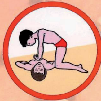
Выполнение непрямого массажа сердца