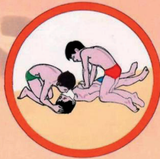
Выполнение одновременно массажа сердца и искусственного дыхания