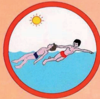
Транспортировка потерпевшего с поддержкой за волосы