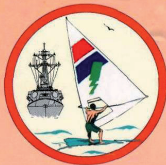
Не пересекайте курс.